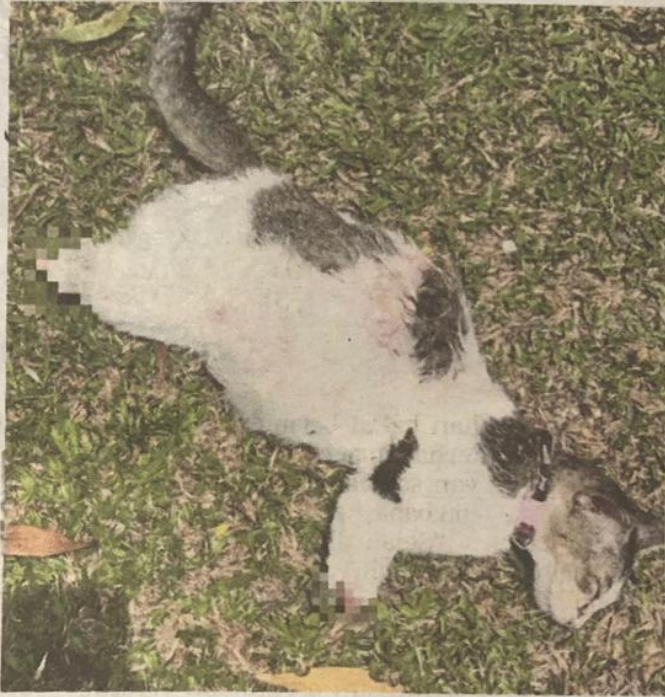
'Cantik' ditemui mati dengan empat kakinya dipotong.

"Saya tidak dapat gambarkan bagaimana keadaan dan kesakitan dirasakan Cantik ketika diperlaku-