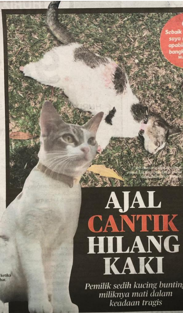
CANTIK ketika masih sihat.

"Lebih menyedihkan terdapat najis keluar mungkin