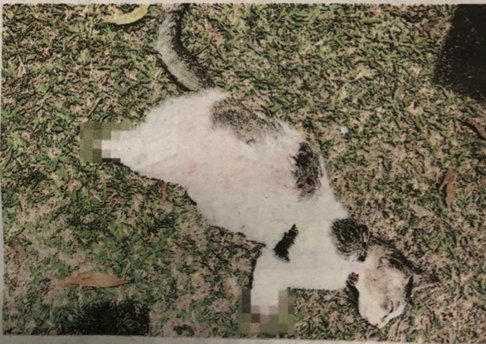
GAMBAR tular seekor kucing betina yang bunting ditemui mati dengan empat kakinya dipotong di Gombak kelmarin.